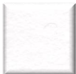
OP | Bianco Total