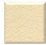
41M | Seda