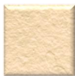
40T | Bone