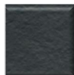
22T | Negro