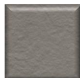
37T | Cenere