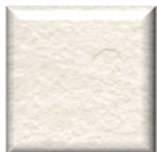
OT | Bianco Roto