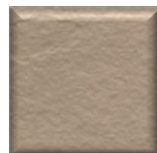
36T | Capuccino