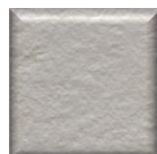
31T | Gris