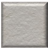
31T | Gris