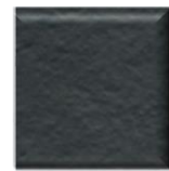
22T | Negro