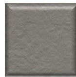
37T | Cenere