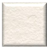
OT | Bianco Roto