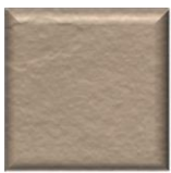
36T | Cappuccino