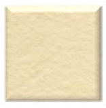
41M | Seda