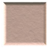
40M | Nude