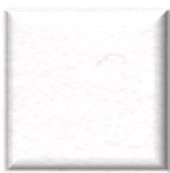
OP | Bianco Total