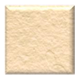
40T | Bone