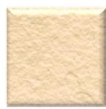
40T | Bone