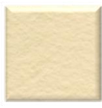
41M | Seda