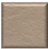
36T | Cappuccino